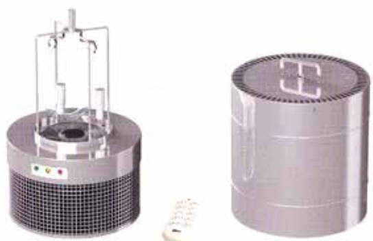
СВЕТОЛИТ АЭРО (в режиме открытого переносного облучателя)