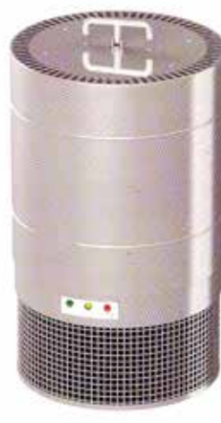
СВЕТОЛИТ АЭРО (в режиме переносного рециркулятора)